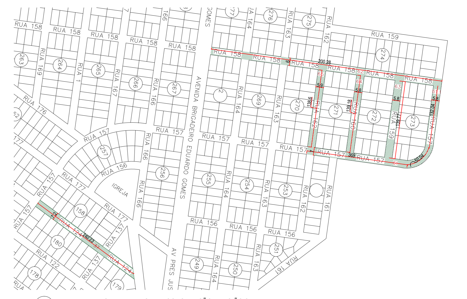
PLANTA DE RECAPEAMENTO E RECONSTRUÇÃO - REGIÃO 2