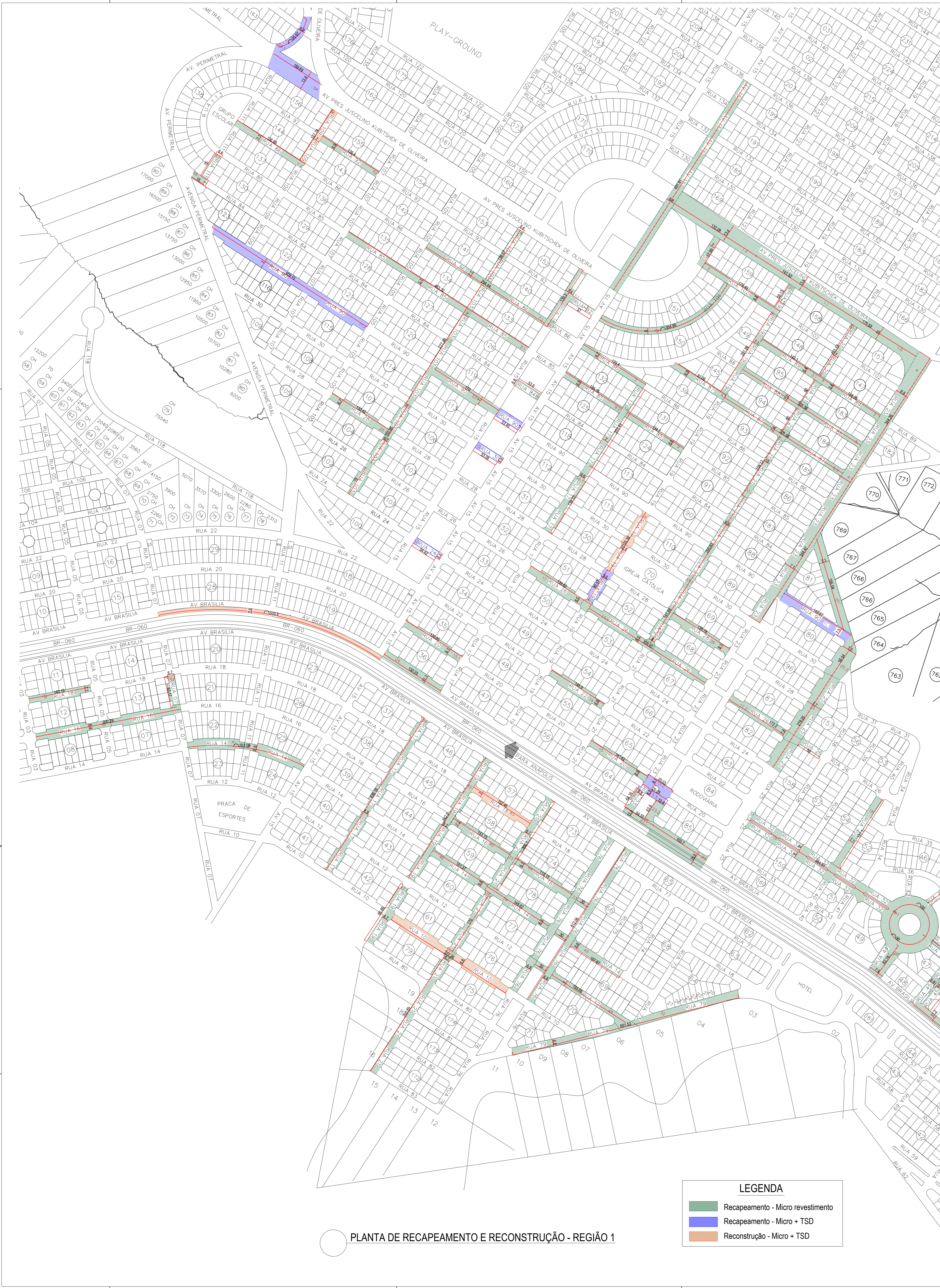
PLANTA DE RECAPEAMENTO E RECONSTRUÇÃO - REGIÃO 1