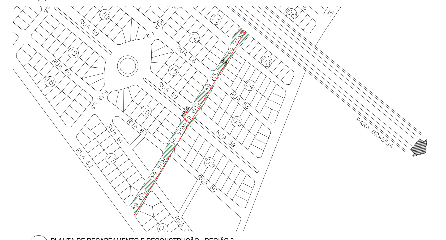
PLANTA DE RECAPEAMENTO E RECONSTRUÇÃO - REGIÃO 3