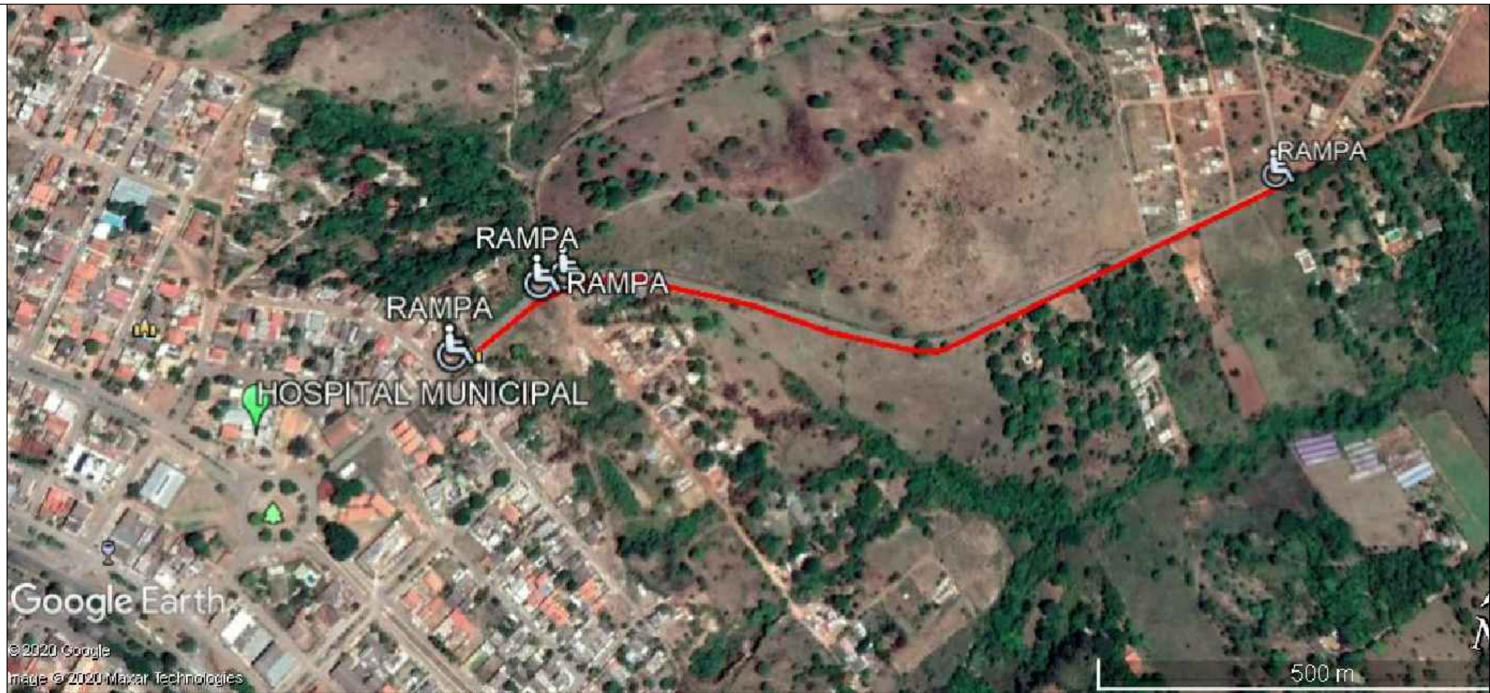
DETALHA CALÇADA E RAMPA