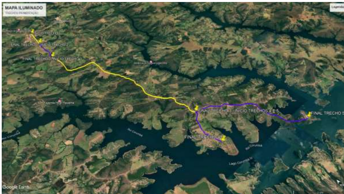
Figura 1 – Segmentos da Estrada Municipal Serra do Ouro – (Google Earth).

3.1.3. Observa-se no local que o segmento possui traçado não pavimentado e bem consolidado, com dimensões aproximadas da plataforma existente variando entre 15,00m e 20,00m. Assim este segmento pode ser aproveitado para compor o traçado definitivo, entretanto, algumas alterações ou adequações locais poderão ser necessárias.